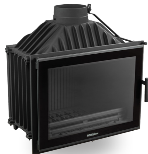
Szyby / Glass: DEKOR, NORMAL