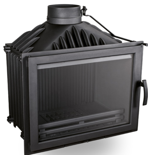
Szyby / Glass: DEKOR, NORMAL