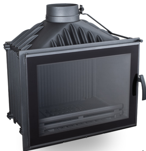
Szyby / Glass: DEKOR, NORMAL