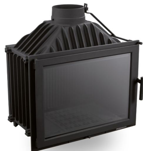
Szyby / Glass: DEKOR, NORMAL